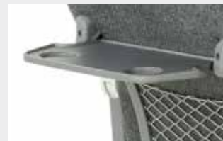
Tisch an Rücken / Small table