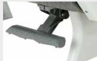
Fußstütze 4 Positionen / Footrest 4 positions