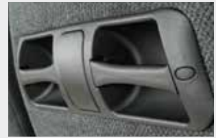
Vertikaler Haltegriff / T compact handle