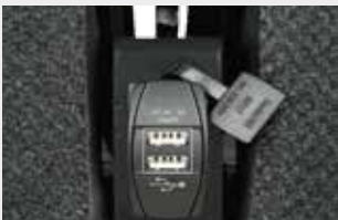
USB Stecker (Breite 1015 mm) / USB connector (width 1015 mm)