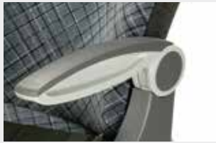
ArMLEHNE Mitte / Wand / Armrest central - side