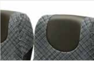
Kopflatz / Headrest pad