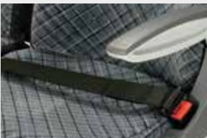
Aufrollbarer 2-Punkt-Gurt / Retractable 2pt safety belt