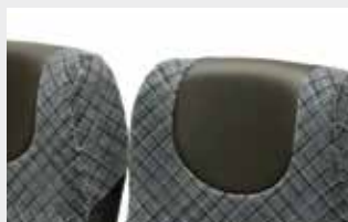
Appui-tête rond / Poggiatesta rotondo