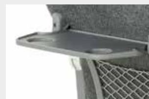
Tablette solidaire / Tavolino