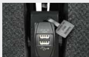
Connecteur USB (largeur 1015 mm) / Connettore USB (larghezza 1015 mm)