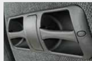
Poignée compact T / Maniglia a T compatta