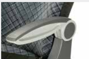
Accoudoir central/côté / Bracciolo centrale/parete