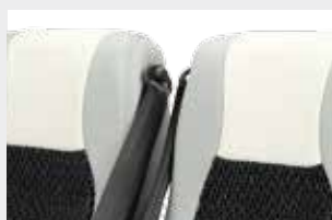
Ceinture 3 points enroulable, extérieure / Cintura a 3 punti con arrotolatore, esterna