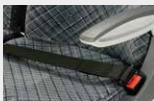
Ceinture 2 points enroulable / Cintura a 2 punti con arrotolatore