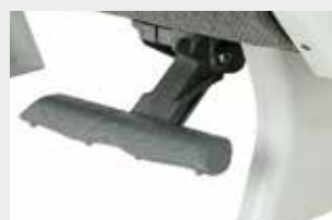
Repose-pieds 4 positions / Poggiapiedi 4 posizioni