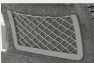
Porte-revues / Portariviste