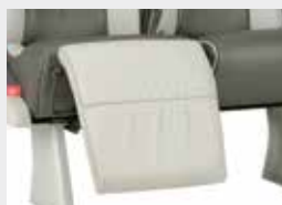
Apoia-pernas / Legrest