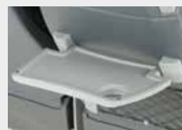
Mesa solidária / Small table