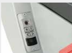
Pré-instalação áudio / Audio pre installation