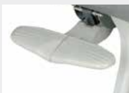
Apoia-pés 2 ou 4 pos / Footrest 2 or 4 positions