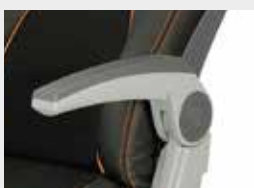
Apoio de braços central-painel / Armrest central-side