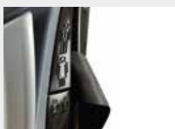
Cinto 3 pontos ajustável em altura / Comfort belt 3 pt