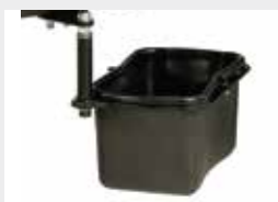
Cesto do lixo / Litter bin