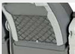
Porta-revistas / Magazine net