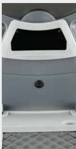
Porta-objetos + USB / Storage tray + USB