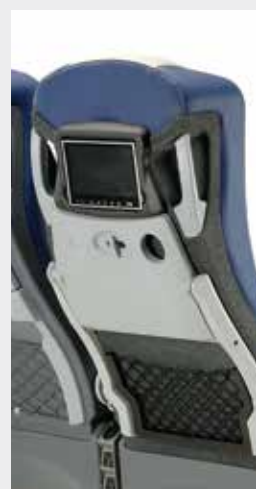
Mesa independente / Independent table