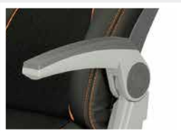
Accoudoir central-côté / Armrest central - side