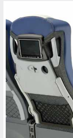
Tablette indépendante / Independent table