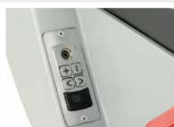
Audio pré-installation / Audio pre installation