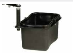
Corbeille à papier / Litter bin