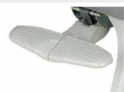
Repose-pieds 2 ou 4 pos. / Footrest 2 or 4 positions