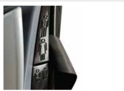
Ceinture 3 pt réglable en hauteur / Comfort belt 3 pt