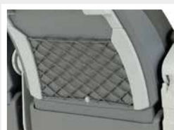
Porte-revues / Magazine net