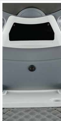
Porte-objets arrière + USB / Storage tray + USB