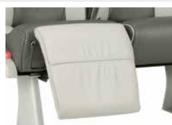
Repose-jambes / Leg rest