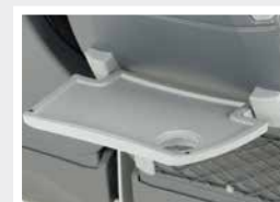
Tablette solidaire / Small table