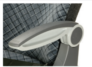
Armlehne Mitte / Armrest central - side