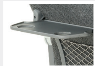
Tisch an Rücken / Small table