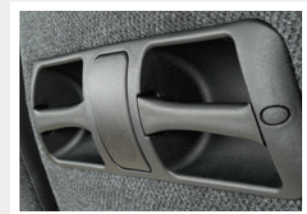
Vertikaler Haltegriff / T compact handle