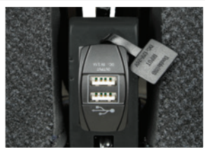
USB Stecker (Breite 1015 mm) / USB connector (width 1015 mm)