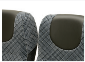
Kopflatz / Headrest pad