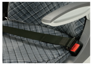
Aufrollbarer 2-Punkt-Gurt / Retractable 2pt safety belt