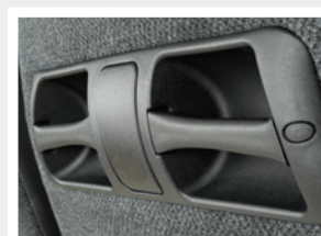
Poignée compact T / Maniglia a T compatta