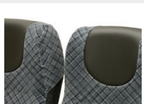
Appui-tête rond / Poggiatesta rotondo