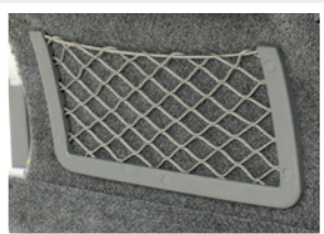
Porte-revues / Portariviste