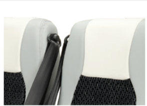
Ceinture 3 points enroutable, extérieure / Cintura a 3 punti con arrotolatore, esterna