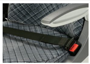
Ceinture 2 points enroutable / Cintura a 2 punti con arrotolatore