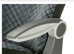
Accoudoir central/côté / Bracciolo centrale/parete