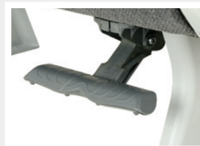
Repose-pieds 4 positions / Poggiapiedi 4 posizioni