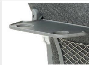
Tablette solidaire / Tavolino